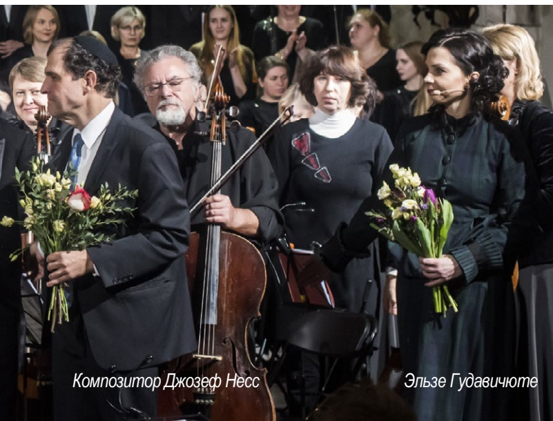
Композитор Джозеф Несс